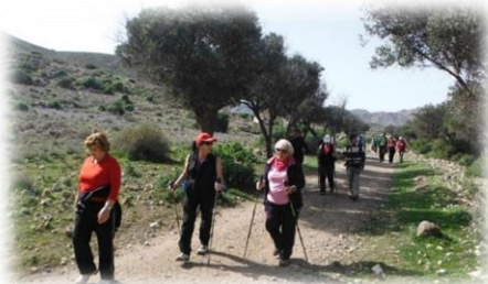
Promoción de la salud y ajuste físico