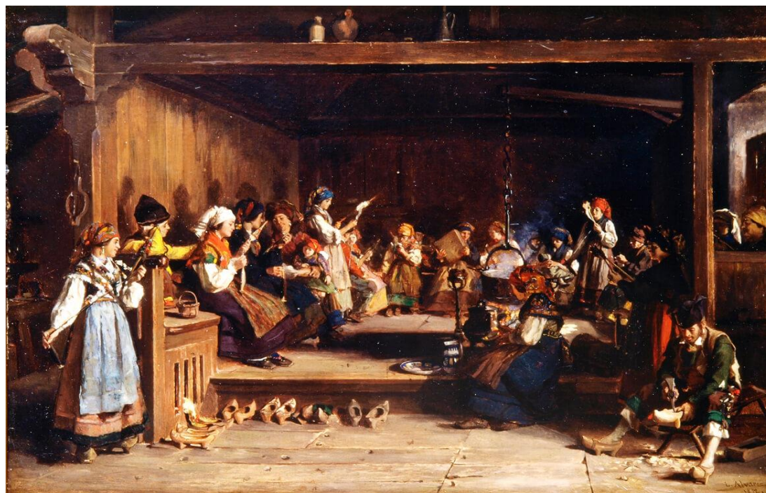
Filandón, fiandón, filorio, hilandorio, hilandera, serano

Tal reunión se solía hacer alrededor del hogar, con los participantes sentados en escaños o bancadas.